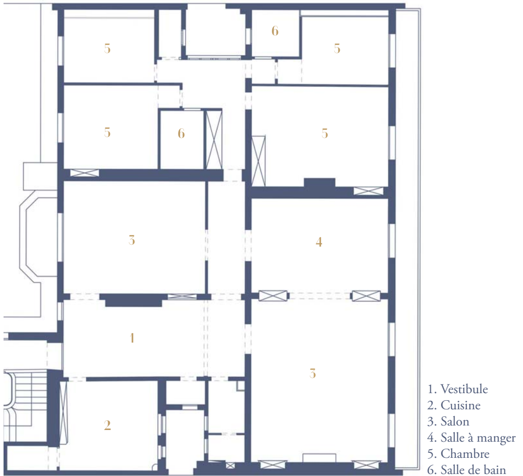
PLAN DE L'EXISTANT